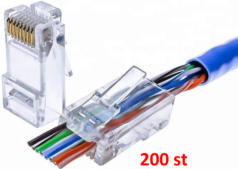
RJ45 Hane Pass-Through Cat6 – UTP Frp. 100 st/påse

Pass-through RJ45-kontakt där innerledarna tydligt dras igenom kontakten för garanterad korrekt och snabb anslutning. Kontaktspetsarna är guldbelagda trippelspetsar för perfekt kontaktering!