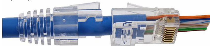
RJ45 Brytskydd Pass Through Frp. 100st/påse