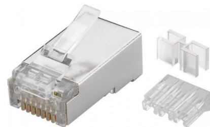
RJ45 Hane Cat6A - STP Art.nr. 253-16