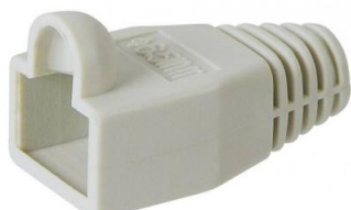
Brytskydd för RJ45-kontakter - grå Art.nr. 249-16