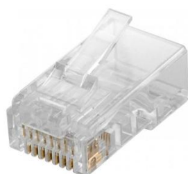
RJ45 Hane Cat6 - UTP Art.nr. 251-16

Art.nr. 320-06 Crimptång RJ45/12/11 Art.nr. 321-06 Crimptång RJ45/12/11/10