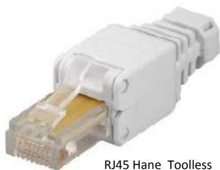
RJ45 Hane Toolless Med LSA-infästning Cat5e - UTP Art.nr. 260-16