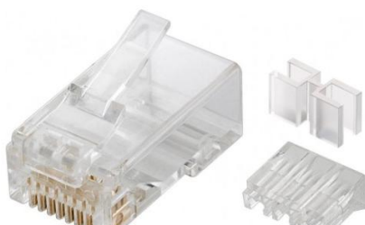
RJ45 Hane Cat6A - UTP Art.nr. 252-16