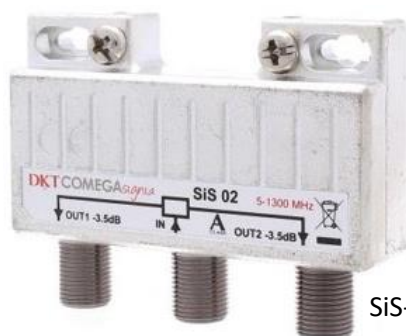
SiS-02 2-vägs splitter