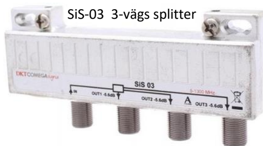
SiS-03 3-vägs splitter

Skärmning: Klass A (EN60728-2) Anslutningar: F-hona (EN61169-24)