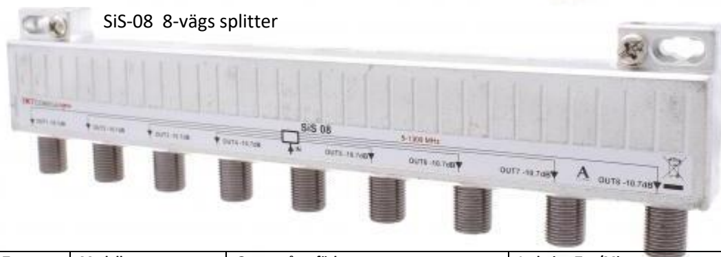
SiS-08 8-vägs splitter